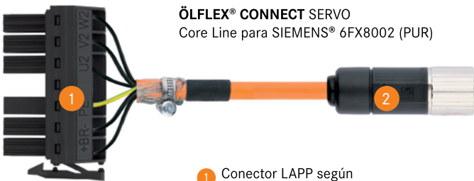
ÖLFLEX® CONNECT SERVO Core Line para SIEMENS® 6FX8002 (PUR)